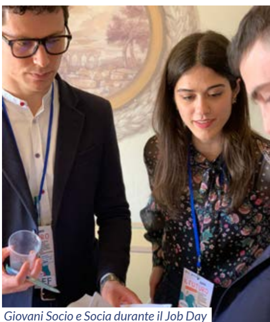
Giovani Socio e Socia durante il Job Day