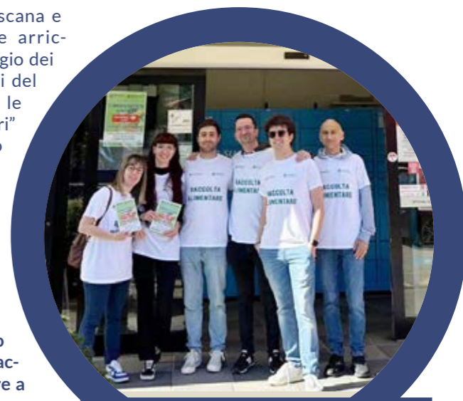
Sabato 18 maggio il Gruppo Giovani Soci della Banca e gli altri Gruppi della Toscana hanno coordinato la raccolta alimentare.

La raccolta è stata promossa e organizzata dai Gruppi dei Giovani Soci e Socie delle BCC toscane. Il Gruppo Giovani Soci Banca di Anghiari e Stia ha raccolto e consegnato alla Caritas Interparrocchiale di Sansepolcro per la distribuzione ai bisognosi: 135 litri di latte, 115 kg di pelati, 88 kg di legumi, 29 kg di tonno in scatola, 18 kg di pasta oltre a biscotti e zucchero. Una risposta concreta ad un bisogno che riguarda tutti i territori. Dal report statistico nazionale 2024 di Cari-