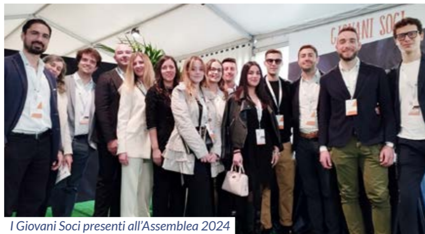
I Giovani Soci presenti all'Assemblea 2024

Il Bilancio di esercizio e il Bilancio Sociale (disponibile sul sito della Banca) descrivono l'impatto generato da una banca di comunità raccogliendo e investendo nel suo territorio.